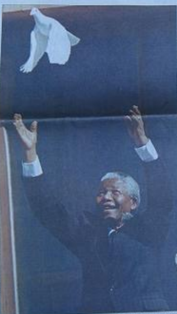
Man Nelson Mandela laat 'n wit hert toe die die Kaapre Paarde kant stek by die president verkies in die 6de Nasionale Vergadering.